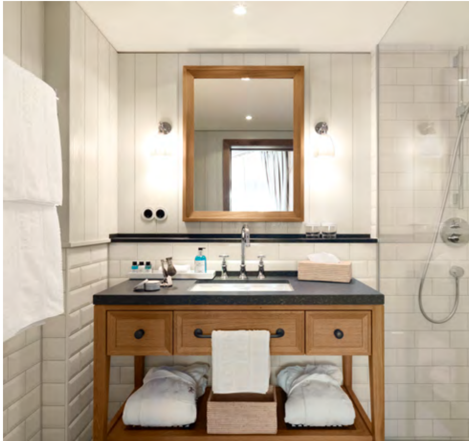
Wohlfühlen im gemütlichen Comfort Zimmer