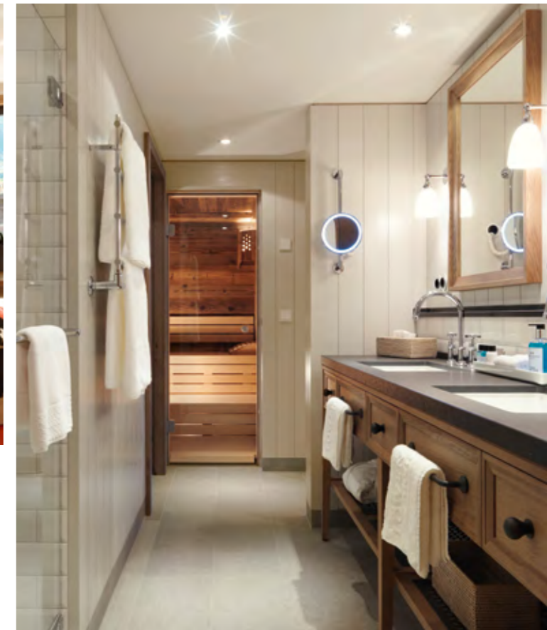
Exklusives Wohngefühl in der Löwen Suite