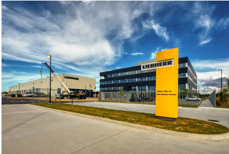
Exterior_Frontage_Liebherr_US_Newport_News_04_RedDoor_Print (300 dpi) Liebherr USA, Co. Newport News