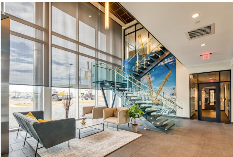
Lobby_Liebherr_US_Newport_News_11_RedDoor_Screen (96 dpi).jpg