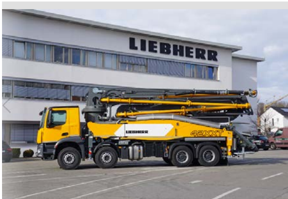
liebherr-42XXT-pump.jpg Autobetonpumpe 42 XXT mit Powerbloc.