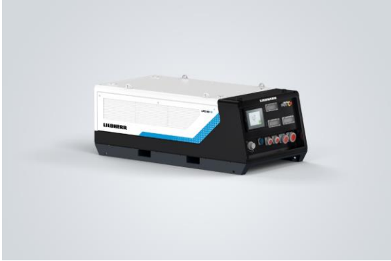
liebherr-liduro-power-port-01.jpg Liduro Power Port – LPO 80