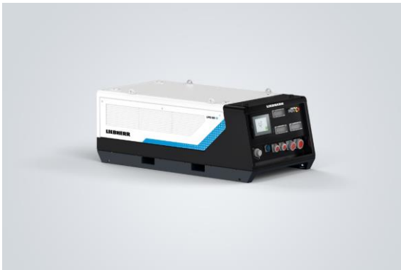
liebherr-liduro-power-port-01.jpg Liduro Power Port – LPO 80