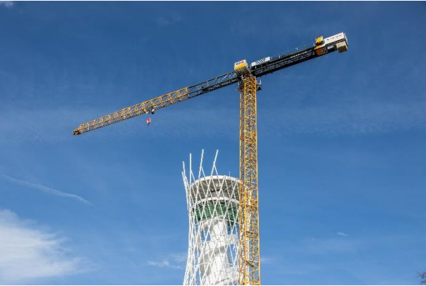
liebherr-340-ec-b-16-hexenbesen-03.jpg La Liebherr 340 EC-B 16 trabaja en la Escoba de Bruja bajo el cielo azul.