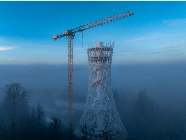
liebherr-340-ec-b-16-hexenbesen-02.jpg La grúa Liebherr al amanecer en la Escoba de Bruja.