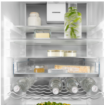
SmartSteel 후면 패널

손끝으로 조작하세요. 터치 디스플레이를 통해 리페어를 간편하고 직관적으로 조작할 수 있습니다. 모든 기능은 디스플레이에 명확하게 표시됩니다. 손가락으로 가볍게 터치하면 냉장고의 기능을 쉽게 선택하거나 현재 온도를 확인할 수 있습니다.