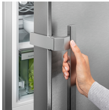
슬림라인 도어 핸들

우아한 SmartSteel 소재의 후면 벽은 Liebherr에 세련된 디자인과 느낌을 더합니다. 스테인리스 스틸은 식품 안전과 위생을 고려하여 설계되어 음식에도 좋은 환경을 제공합니다. 또한 지문이 잘 묻지 않아 깔끔한 외관을 유지할 수 있습니다.