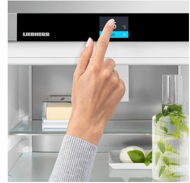
Touch & Swipe display

세련되고 절제된 외관의 디자인을 완성하는 SmartSteel 마감은 주방 공간의 품격을 높여줍니다. 가로로 연마된 스테인리스강 표면은 부드러운 광택과 촉감을 제공하며, 특별한 코팅으로 지문이 잘 남지 않고 스크래치에도 강합니다. 언제나 고급스럽고 깨끗한 외관을 유지할 수 있습니다.