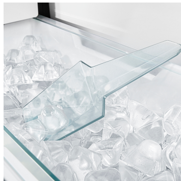
Ice cube scoop

파티나 가족 모임에서도 걱정 없이 차가운 음료를 제공할 수 있습니다. 최대 8kg의 얼음을 저장할 수 있으며, 아이스 스쿵과 텔레스코픽 레일이 장착된 서랍식 트레이 덕분에 얼음을 꺼내기 쉽습니다. 보관 트레이를 조정하면 얼음 양을 줄이고 그 아래 공간을 다른 냉동 식품 보관용으로 활용할 수 있습니다. 옆의 서랍도 냉동 식품 보관 공간으로 활용 가능합니다.