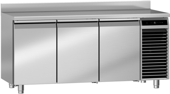
Table réfrigérée avec réfrigération dynamique Performance