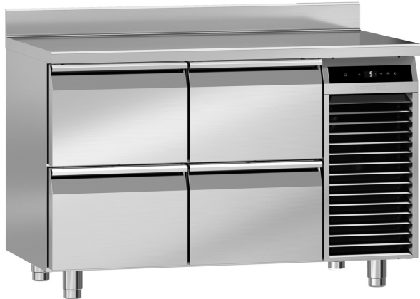
Table réfrigérée avec réfrigération dynamique Performance