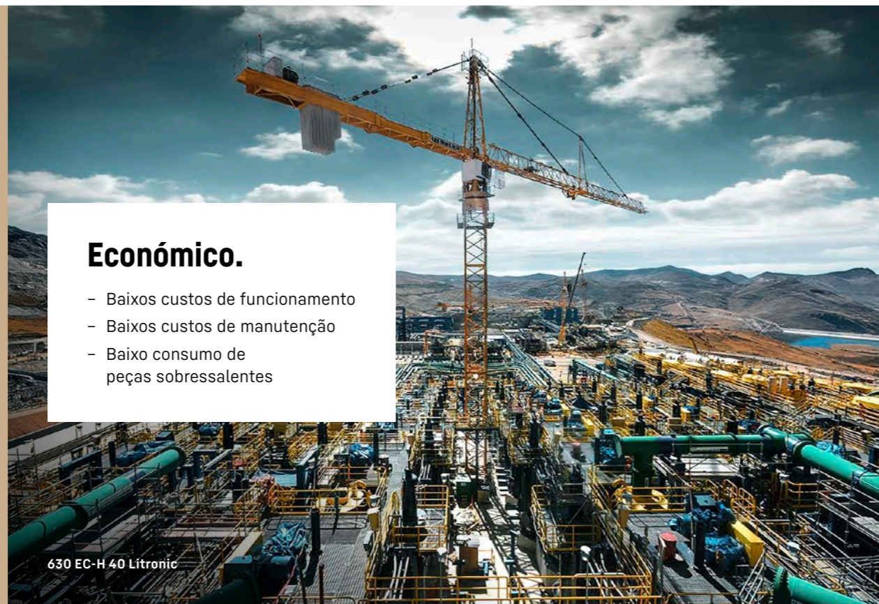
630 EC-H 40 Litronic