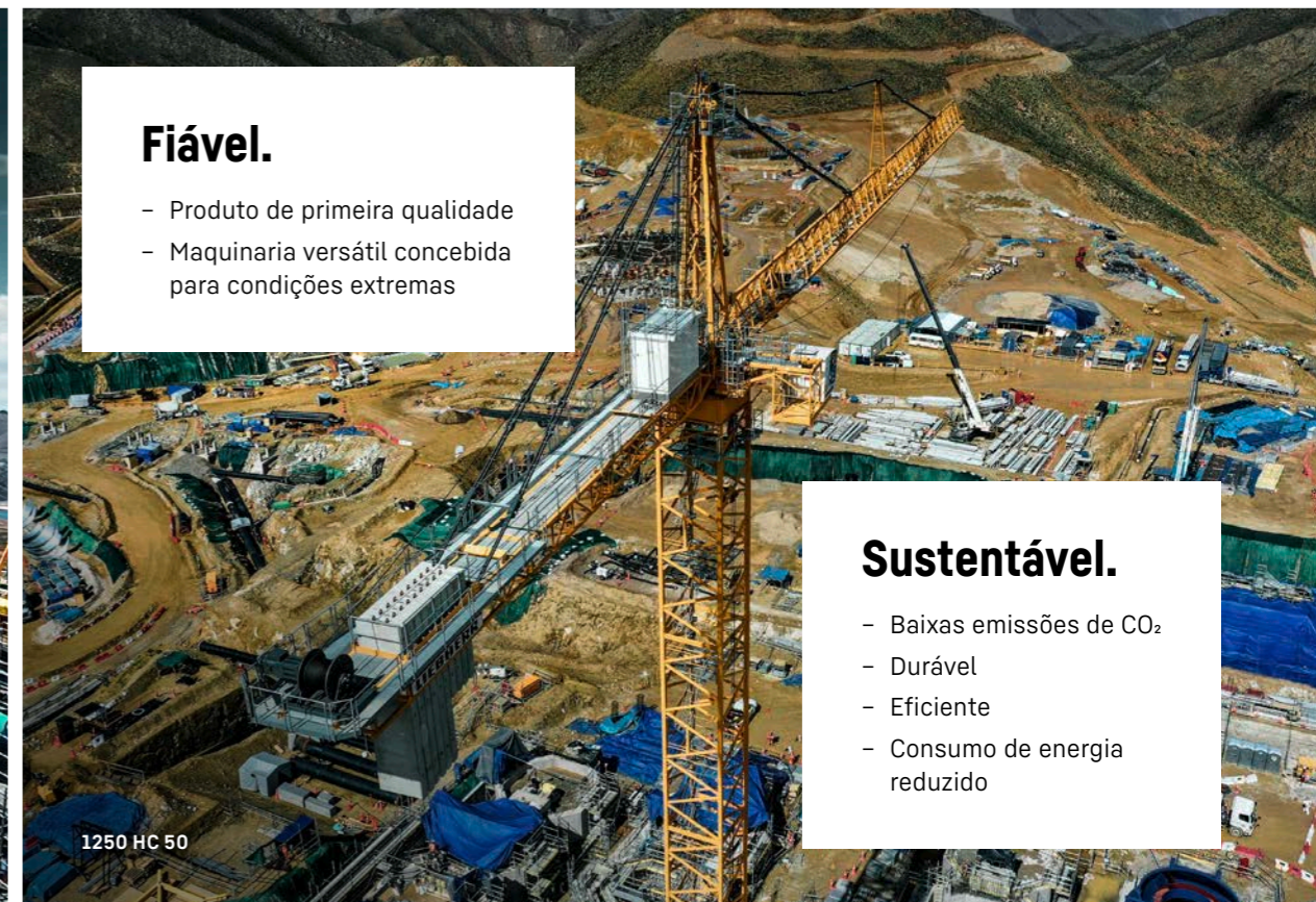
1250 HC 50