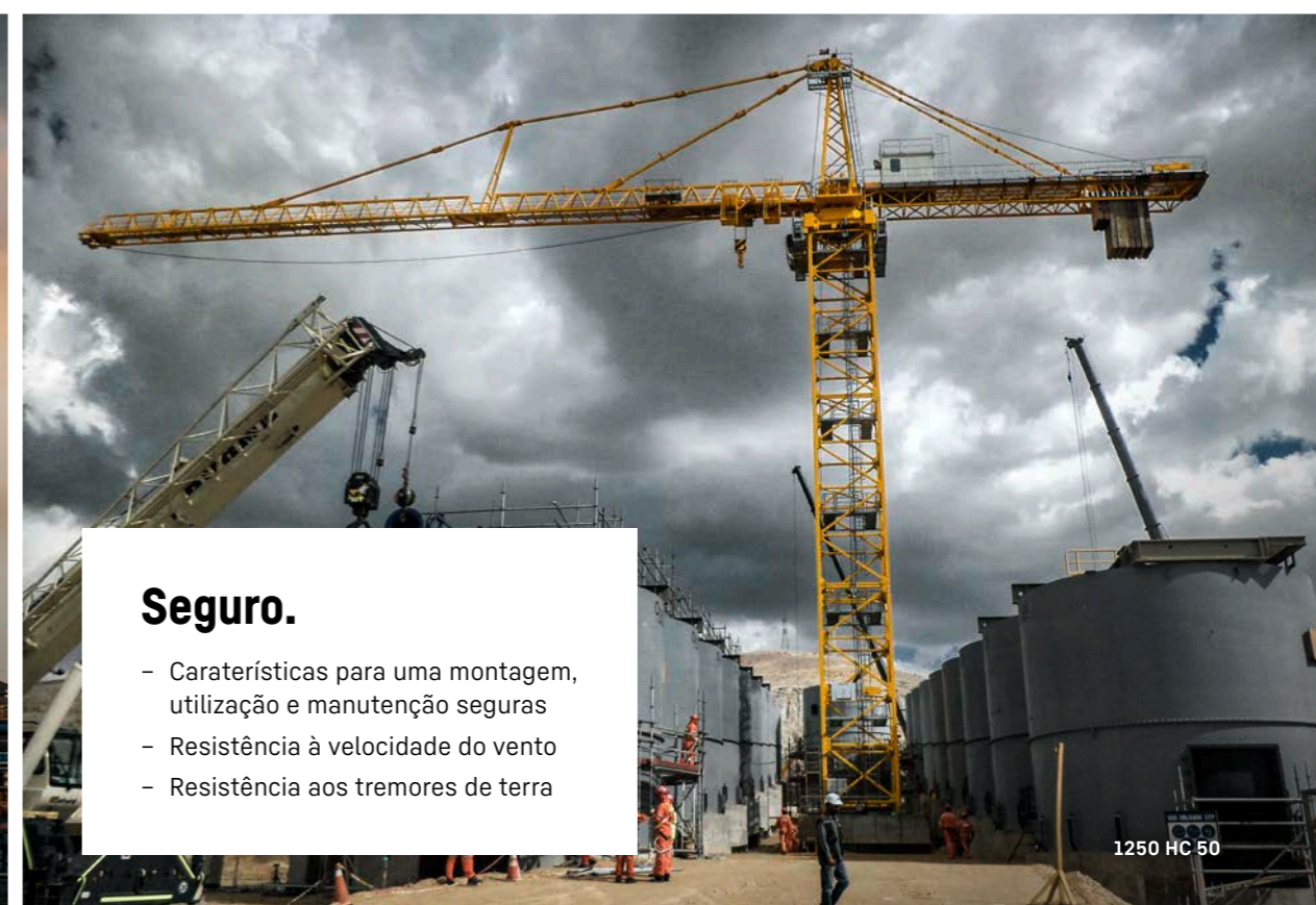
1250 HC 50