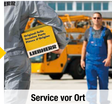
Service vor Ort